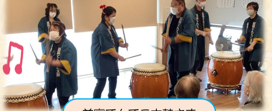
益富でんでこ太鼓さま