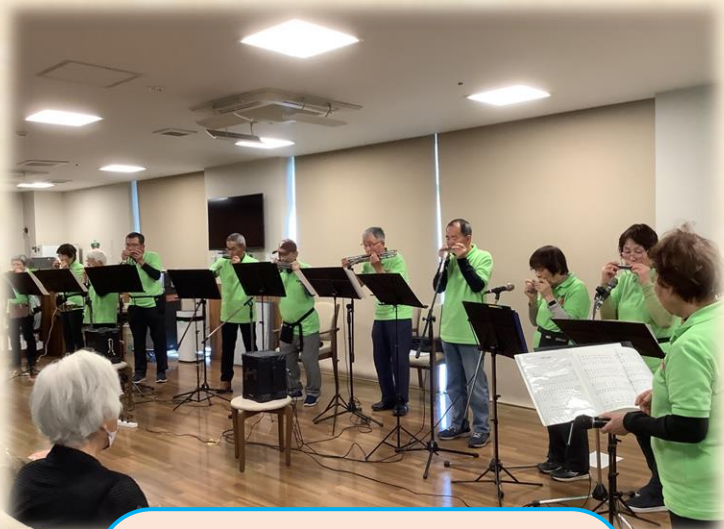
高橋ハーモニカフレンズさま