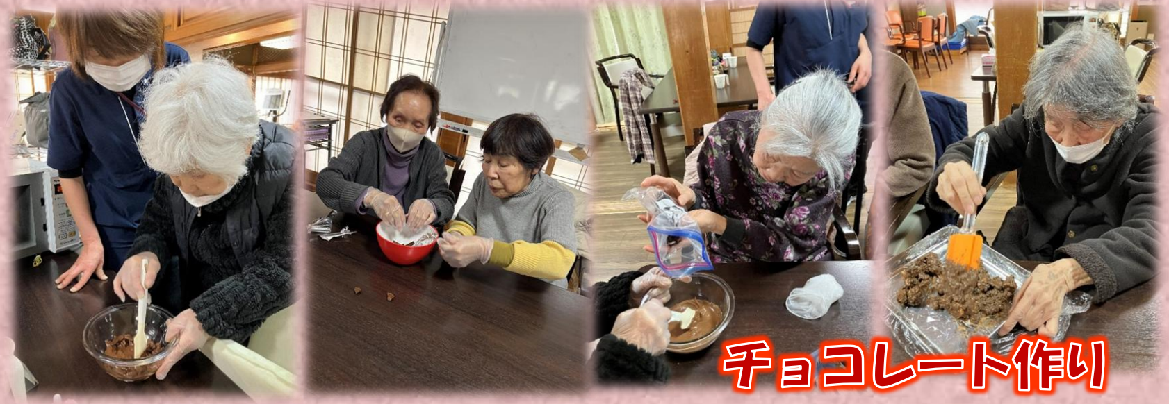
チョコレート作り