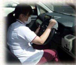
帰宅したら車内の消毒！