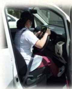
座席、ハンドル確認！